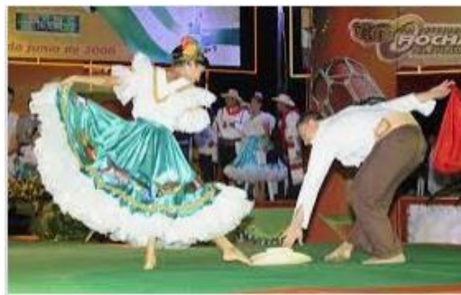
El Sanjuanero huilence